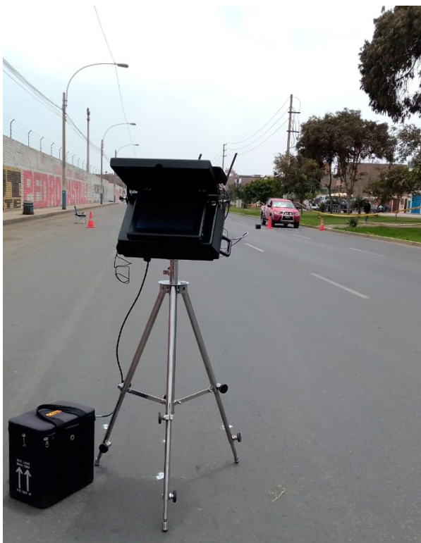
ILUSTRACIÓN DEL MEDIDOR DE VELOCIDAD PORTÁTIL CON NÚMERO DE SERIE R08081